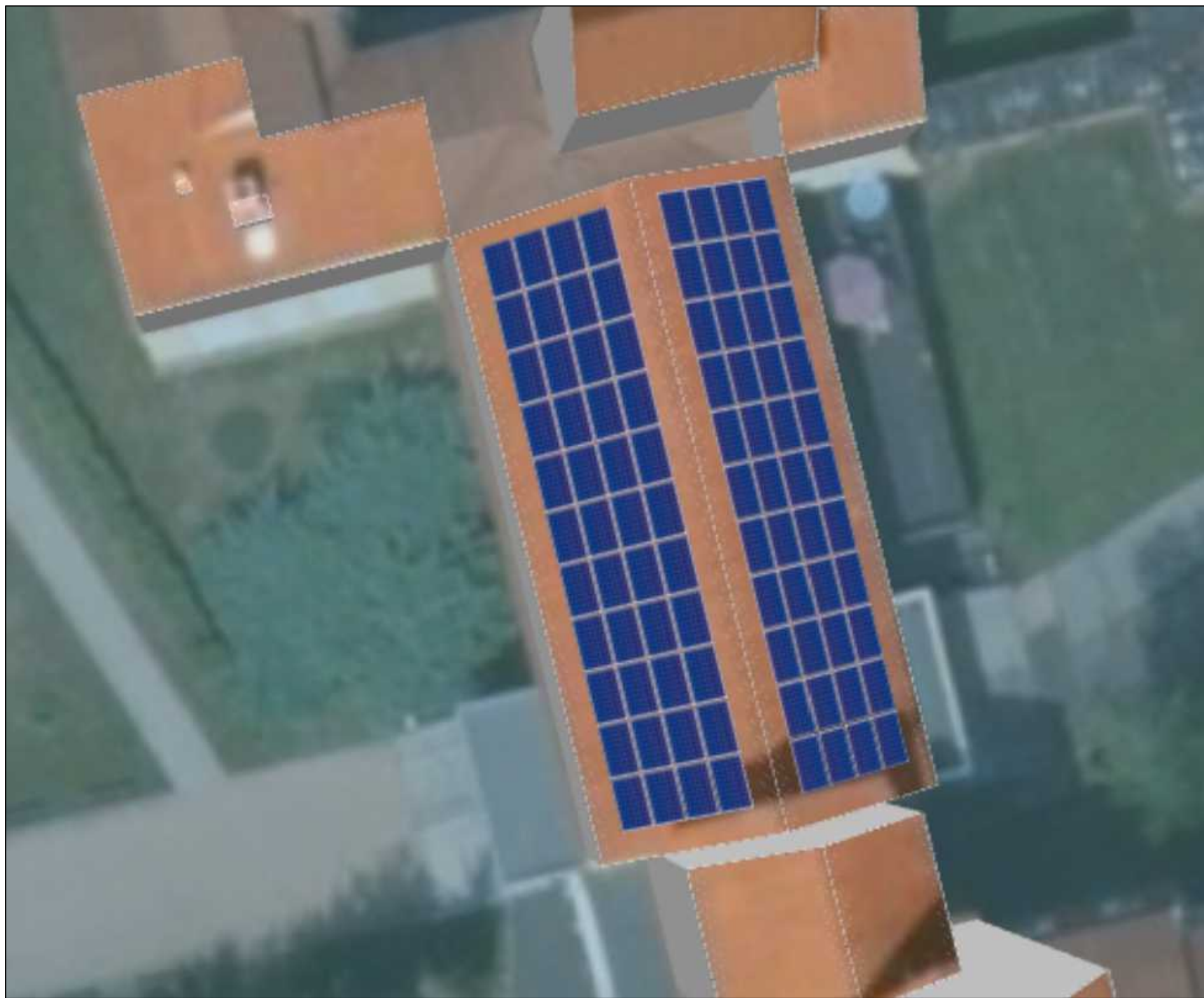
FVE DS U Pramene 42,24 kWp